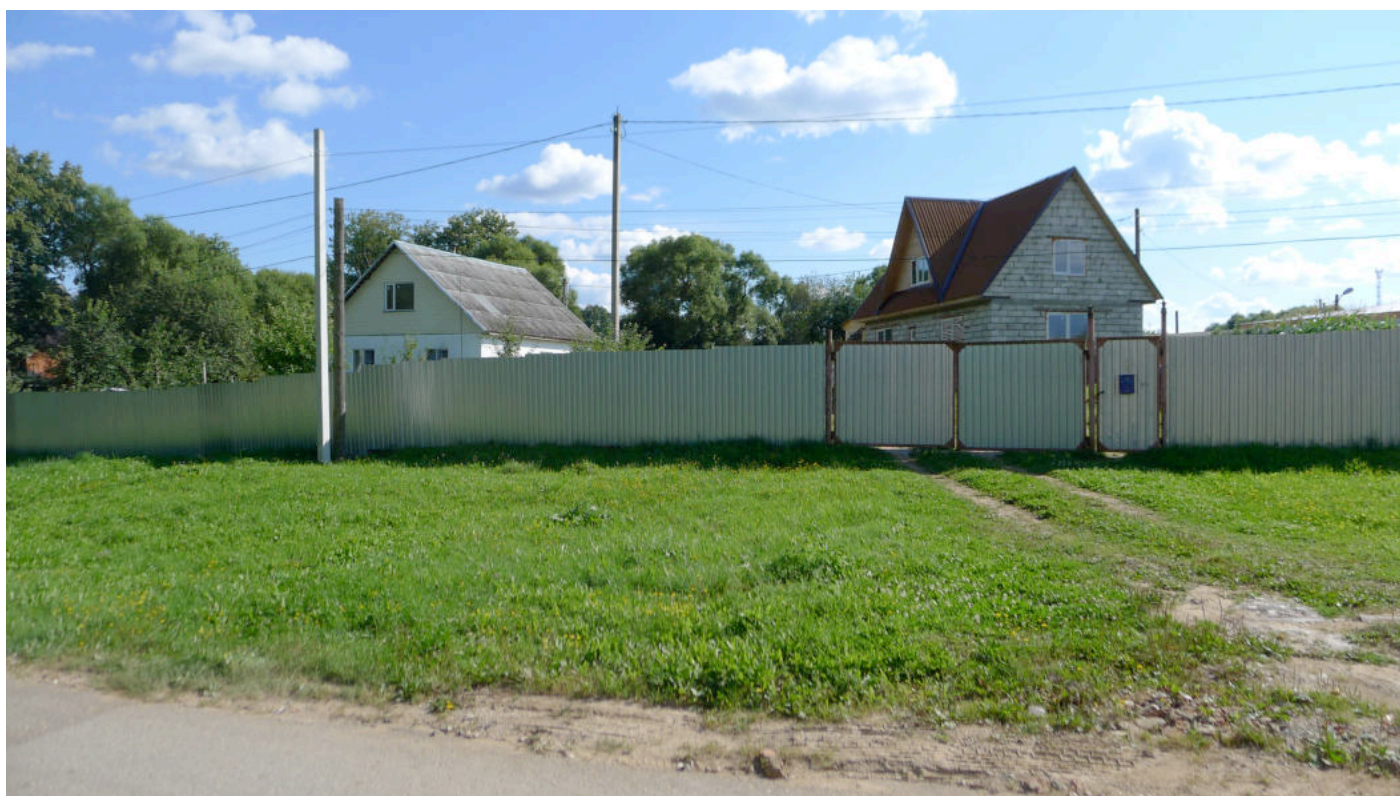
Фото 2. Место бывшей церкви – на участках двух 1-этажных домов по адресу: ул. Боровская, 19 – 19а. Вид с севера.