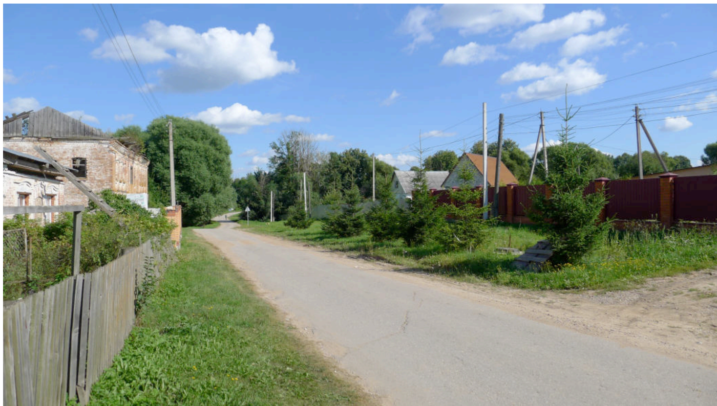
Фото 1. Место бывшей церкви – в правой части кадра, на участках двух 1-этажных домов по адресу: ул. Боровская, 19 – 19а. Вид с северо-запада.