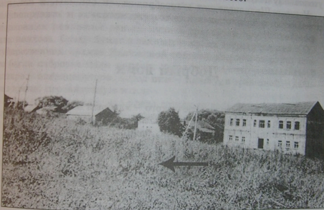
Место, где располагался Покровский старообрядческий храм в Щелканове. 1997 г.