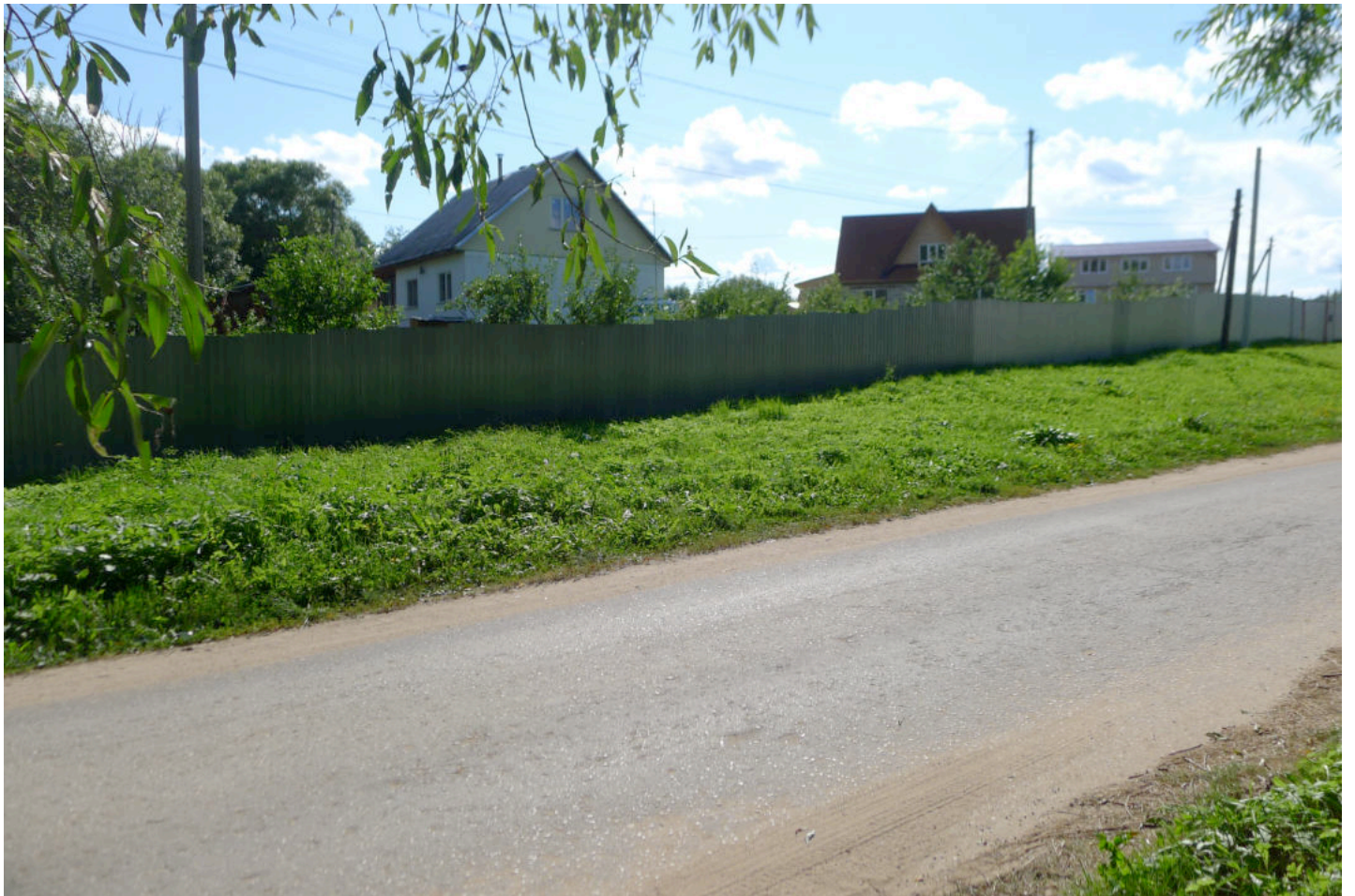
Фото 3. Место бывшей церкви – на участках двух 1-этажных домов по адресу: ул. Боровская, 19 – 19а. Вид с северо-востока.